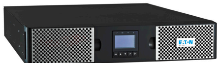
Eaton 9PX-ECO UPS