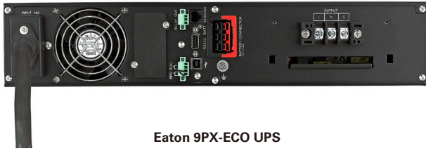
Eaton 9PX-ECO UPS